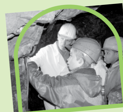
... die Eifel von unten