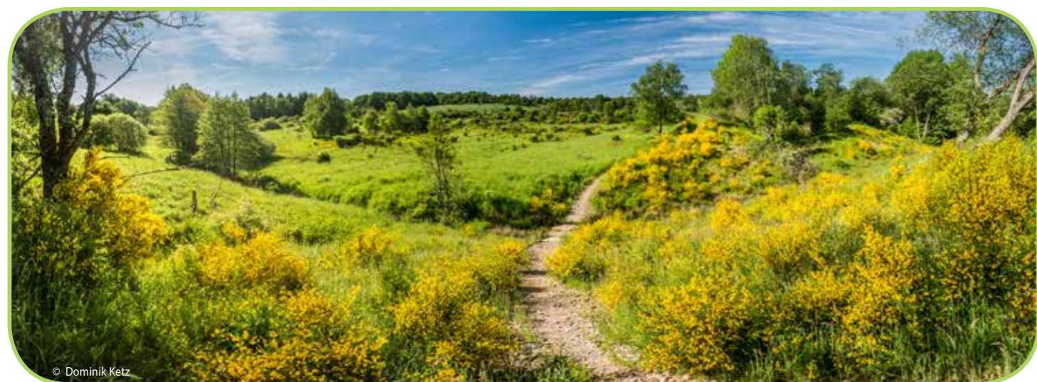
Dreiborner Hochfläche, Stadt Schleiden