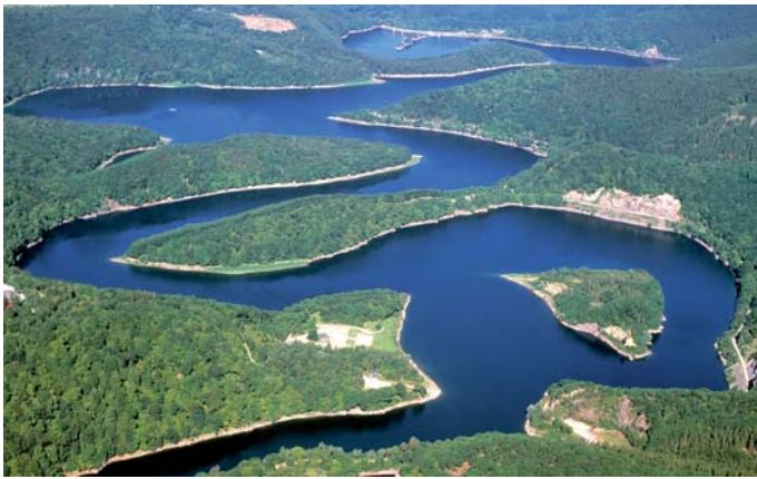
Die zweite Etappe führt Sie entlang des Urfsees durch den Nationalpark Eifel.