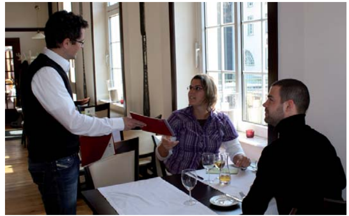
Genießen Sie Ihr Schlemmer-Menü bei drei Nationalpark-Gastgebern.