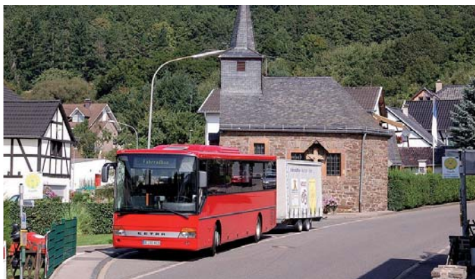
Um 17:00 Uhr bringt Sie der Fahrradbus von Gemünd zurück nach Höfen.