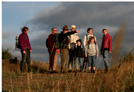
Begleiten Sie die Ranger und Waldführer des Nationalparks bei ihren Touren.