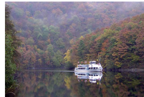
Wanderungen im Nationalpark Eifel lassen sich gut mit Schiffstouren auf dem Rur- oder Obersee kombinieren.