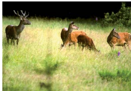
Von der Aussichtsempore in Dreibern aus lassen sich Rothirsche während der Brunft von Mitte September bis Mitte Oktober gut beobachten.