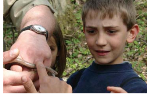
Der Erfahrungsraum Natur bietet vielfältige Naturbegegnungen, weckt die Neugier und stellt vor persönliche Herausforderungen.

Die Wildnis mit ihrer Tier- und Pflanzenwelt steckt voller Geheimnisse. Um sie zu lüften, müssen wir ihr mit offenen Augen begegnen und neugierig Fragen stellen. Ob beim Spurenlesen, bei der Pflanzenkunde, Wasseruntersuchung oder anderen von der Gruppe gewählten Themen, die Natur selbst ist die Lehrmeisterin.