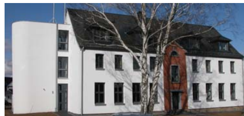
Das neue Nationalpark-Gästehaus in Heimbach-Hergarten bietet Unterkünfte für Menschen mit und ohne Behinderungen

Rureifel-Tourismus e.V. An der Laag 4 52396 Heimbach Tel: 0 24 46. 805 79-0 Fax: 0 24 46. 805 79 30 info@rureifel-tourismus.de www.heimbach-eifel.de