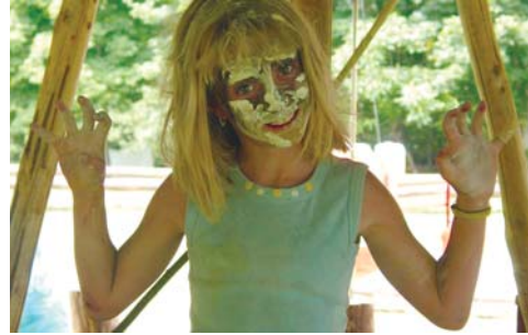
Kreativ und wild - Wildnis inspiriert und weckt die Lebensgeister.