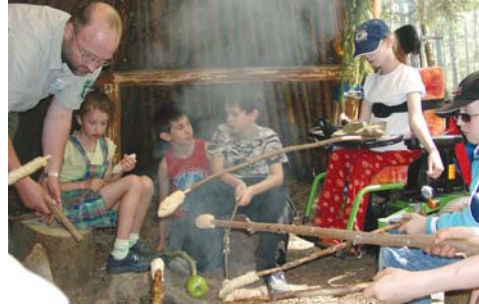
Beim Feuer machen, picknicken und Geschichten erzählen am Lagerfeuerplatz wächst die Gruppe enger zusammen.

Durch Projektarbeiten finden die Gruppen in der Wildniswerkstatt kreative Antworten auf ihre Fragen zur Wildnis. Wald, Wasser und Wildnis bringen sie dabei auf neue Gedanken, während Wind und Wetter sie mittags beim Picknick am Lagerfeuer enger zusammen führen.