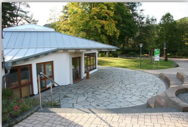
Nationalpark-Tor Gemünd