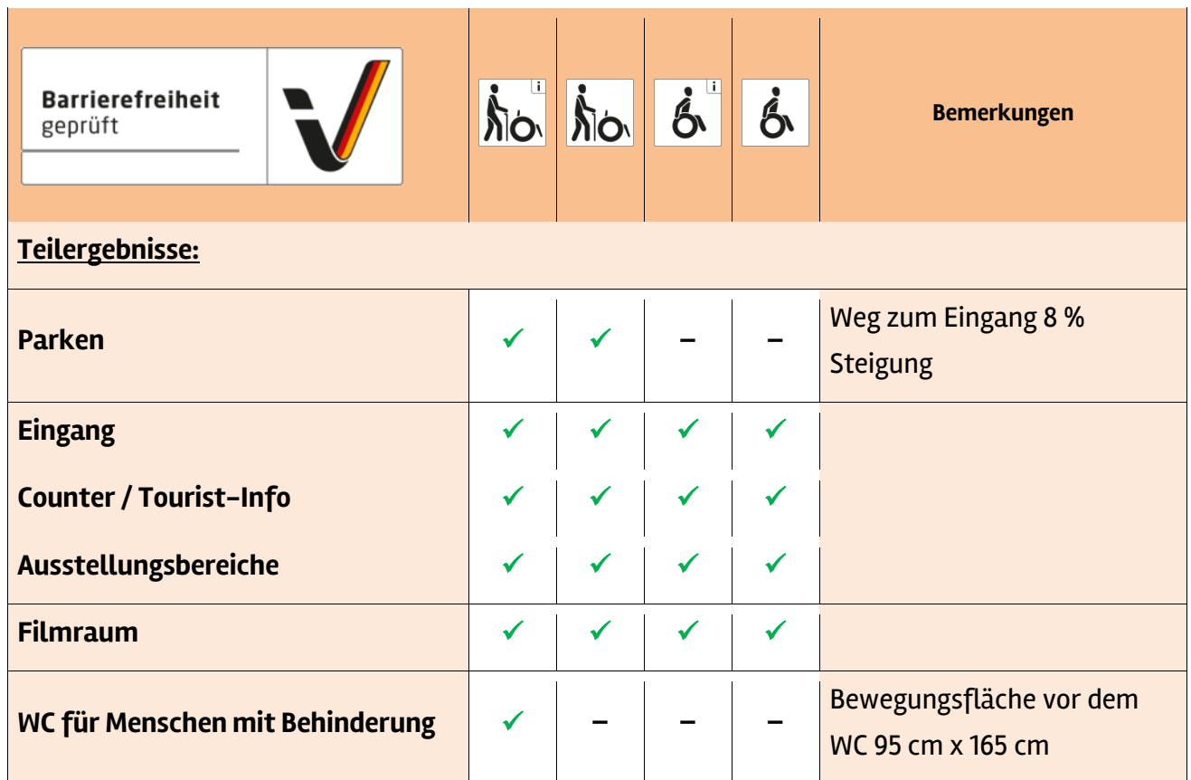
Tabelle 1: Überblick über das Prüfergebnis